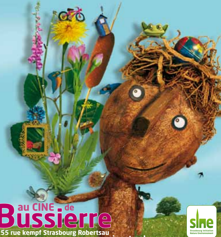
Illustration: Christian Voitz Infographie - Bernard Irmann