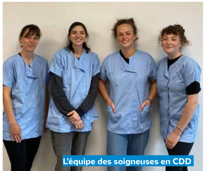
L'équipe des soigneuses en CDD

Un réseau de plusieurs cabinets vétérinaires aide les soigneuses-capacitaires, pour les cas de blessures graves ou de maladies non identifiées.